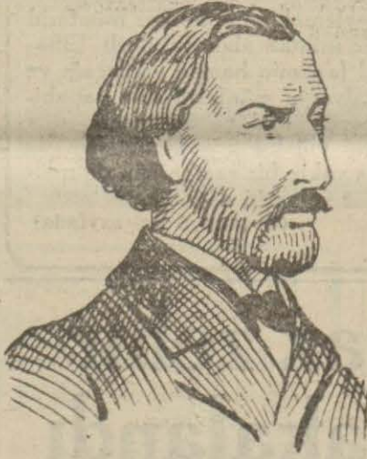
Alfred de Musset

O Pariste, hem asker, hem edip ve müellif olan bir babanın oğluydu, ve Fransanın pek muhterem bir asalet ailesinden gelmişti. 1810 da doğup 1857 de henüz kırk yedi yaşında,