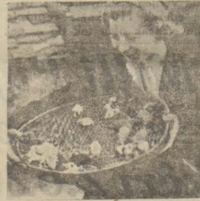
Garib bir resim: Fare meraklısı kadın ve fareleri

Pek te hoş bir mevzu değil, diyeceksiniz ama, cidden tetkik edilmeye değer mabûhî bunlar... Tasavvur ediniz ki, hayvanların mütekimlerinden olmak ve bizlerin mütemadi taciz ve hücumlarına maruz kalmakla beraber, fareler gene de her seferinde bizleri altıtmekte, bir punduna getirip yaşamakta, dünyanın dört bucağına yayılarak her canlı kulu zarara sokmaktadır. İlk yazılardan birinde dediğim gibi, fareler hakikaten zeki hayvanlardır ve biz insanları vasıta ederek bugüne kadar bütün kürede hükümlan olmuşlar, bundan sonra da, hiç şüphesiz, olacaklardır.